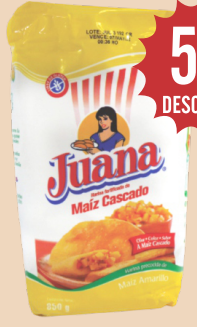
7441000712365 MASA JUANA BLANCA 850 GRS