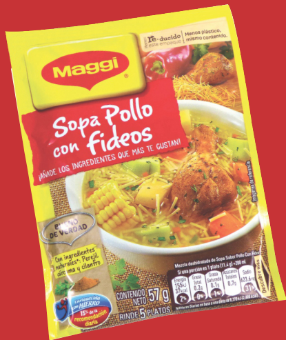
7613035396203 SOPA MAGGI POLLO C FIDEO 57 GRS