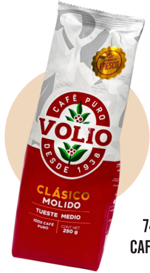
7441003400207 CAFE VOLIO 250 GRS