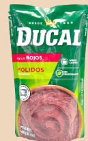
088313590746 FRIJOL DUCAL MOLIDO ROJO SOB 14.1 OZ 400 GRS