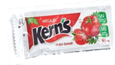
744100000837 SALSA KERN S TOMATE KETCHUP PURA SOBRE 8 GRS