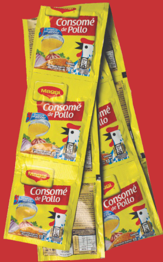
088169407625 CONSUME MAGGI POLLO T/12