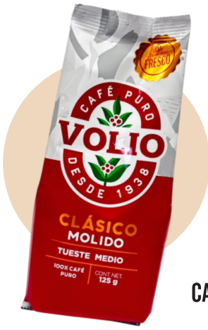
7441003400115 CAFE VOLIO 125 GRS