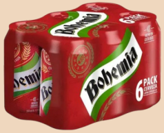
764009010018 CERVEZA BOHEMIA LATA 350 ML SIX PACK