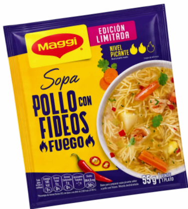
8445292581462 SOPA MAGGI POLLO C FIDEO FUEGO PICANTE 55 GRS