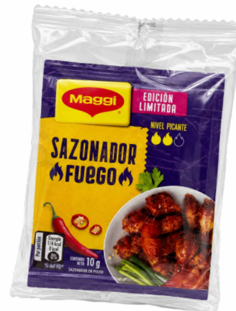
8445292581349 SAZONADOR MAGGI FUEGO SABOR PICANTE 10 GRS PTE/4