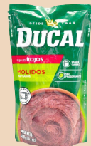
088313590746 FRIJOL DUCAL MOLIDO ROJO SOB 14.1 OZ 400 GRS