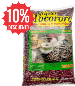
7441057503152 FRIJOL TOCORORO ROJO 800 GRS