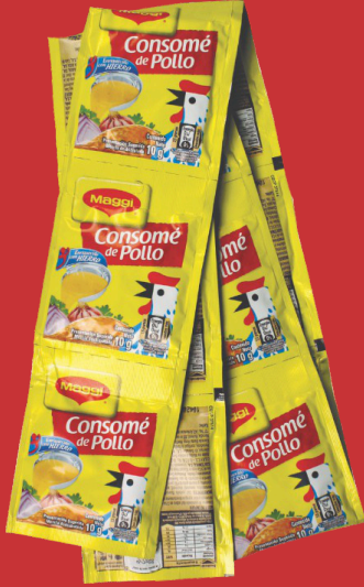
088169407625 CONSUME MAGGI POLLO T/12