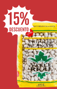
7441057500090 FRIJOL VALLE REAL BLANCO 400 GRS