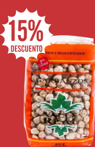
7441057500083 GARBANZO VALLE REAL SOBRE 400 GRS