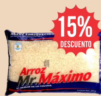
7441057500564 ARROZ MR. MAXIMO 95% 1800 GRS