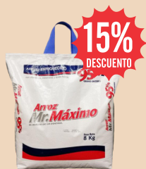
7441057500571 ARROZ MR. MAXIMO 95% SACA 8 KILOS