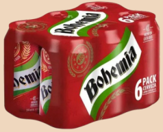
764009010018 CERVEZA BOHEMIA LATA 350 ML SIX PACK