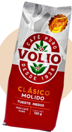
7441003400115 CAFE VOLIO 125 GRS