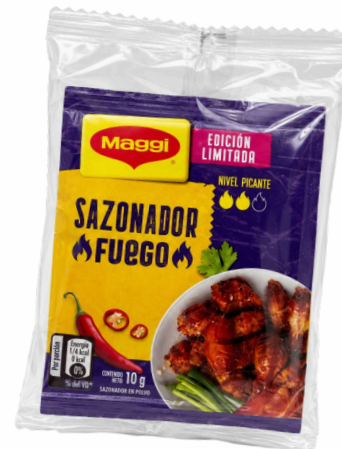
8445292581349 SAZONADOR MAGGI FUEGO SABOR PICANTE 10 GRS PTE/4