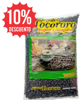
7441057503169 FRIJOL TOCORORO NEGRO 800 GRS