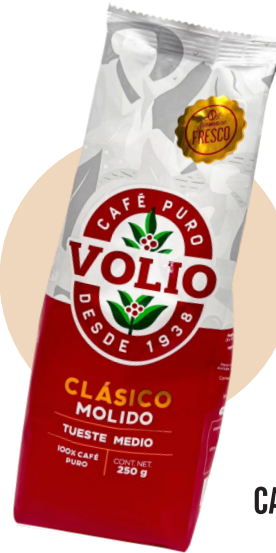
7441003400207 CAFE VOLIO 250 GRS