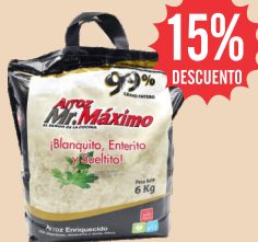
7441057502094 ARROZ MR. MAXIMO 99% SACA 6 KILOS