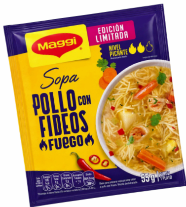
8445292581462 SOPA MAGGI POLLO C FIDEO FUEGO PICANTE 55 GRS