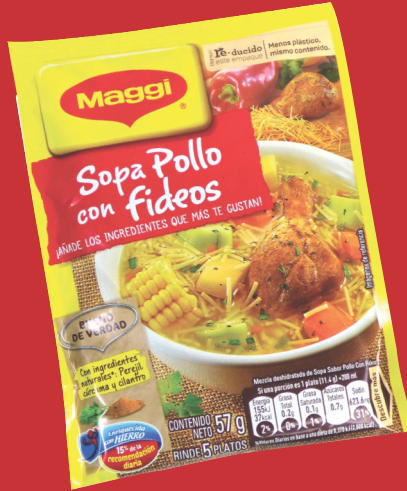
7613035396203 SOPA MAGGI POLLO C FIDEO 57 GRS