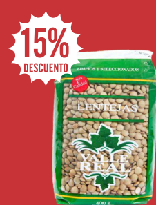
7441057500076 LENTEJAS VALLE REAL 400 GRS