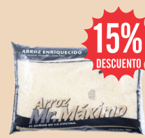
7441057501240 ARROZ MR. MAXIMO 99% 1800 GRS