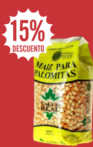
7441057502308 MAIZ PALOMITAS VALLE REAL 400 GRS