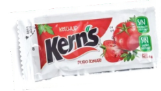
744100000837 SALSA KERN S TOMATE KETCHUP PURA SOBRE 8 GRS