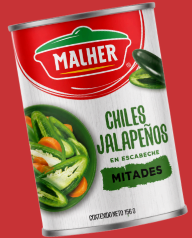
089674070113 CHILE MALHER JALAPEÑO MITADES ORIGINAL 156 GRS